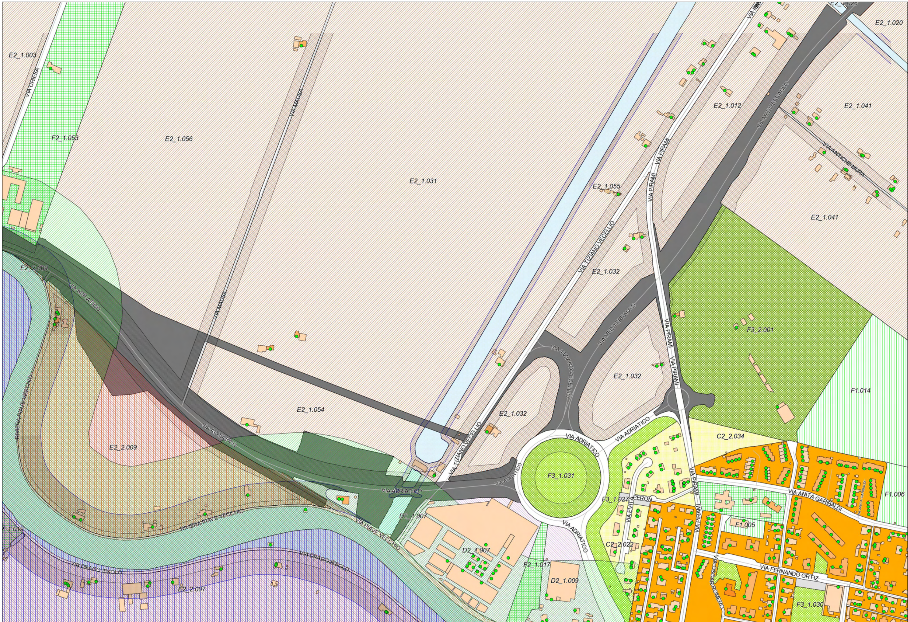
ESTRATTO DEL PRG VIGENTE - 1:5000